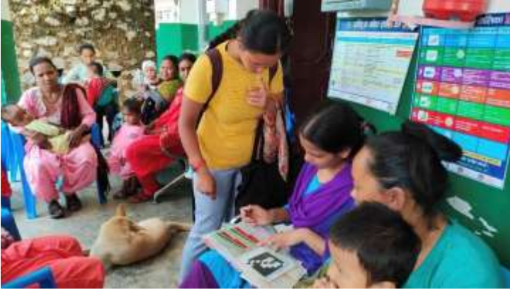
मासिक वृद्धि अनुगमन@दगातुन्डाडा स्वास्थ्य चौकी, बाग्लुङ्ग

अंक १९८, वर्ष ६, २०८१ असार ९, June 23, 2024 आइतबार