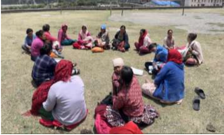
स्वास्थ्य आमा समूह बैठक @ टुकुचे, मुस्ताङ

अंक १९८, वर्ष ६, २०८१ असार ९, June 23, 2024 आइतबार