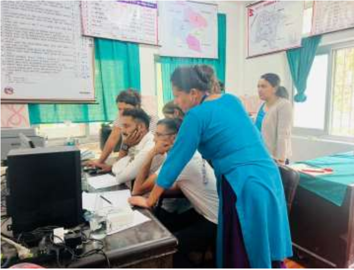
स्वास्थ्य शाखा मंगला गाउँपालिकाको आयोजना र स्वास्थ्य कार्यालय म्याग्दिको सहजीकरणमा नवजात शिशु तथा बालरोगको एकीकृत व्यवस्थापन सम्बन्धी स्थलगत अनुशिक्षण कार्यक्रम सम्पन्न भएको छ।