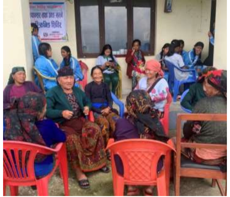
पाठेघरको मुखको क्यान्सर तथा आइड खस्ने र स्तन क्यान्सर स्क्रिनिङ शिविर क्वहोलासोँथरको बाग्लुङ्गपानी स्वास्थ्य चौकी, लमजुङमा सम्पन्न भएको छ।