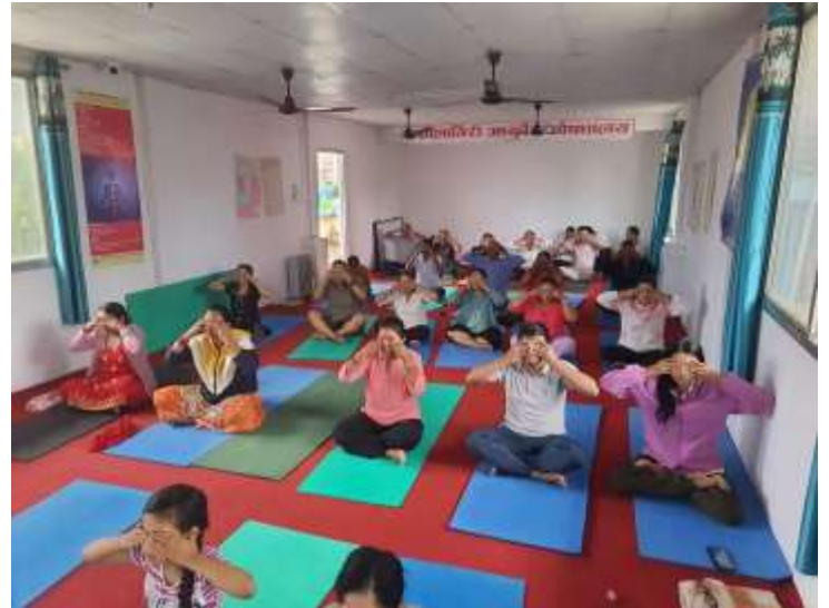
धौलागिरी आयुर्वेद औषधालय, बाग्लुङ्गको आयोजनामा आफू र समाजको लागि योग भन्ने नाराका साथ अन्तराष्ट्रिय योग दिवस सम्पन्न भएको छ।